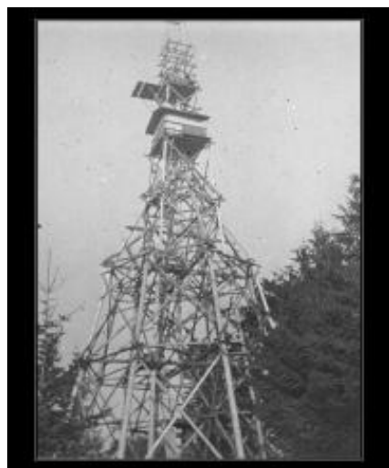
Taková kdysi bývala