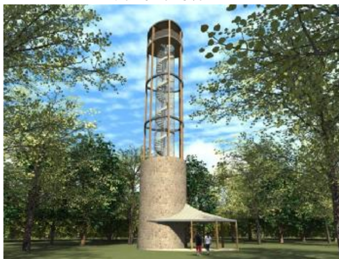
A taková bude