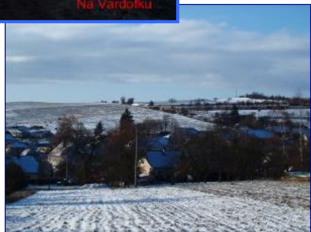
Autor Dalibor Toufar