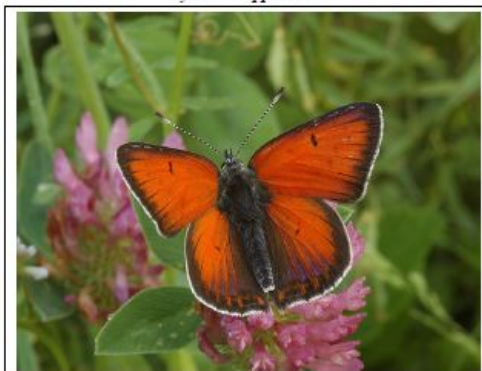
Ohniváček modrolehý Lycaena hippothoe