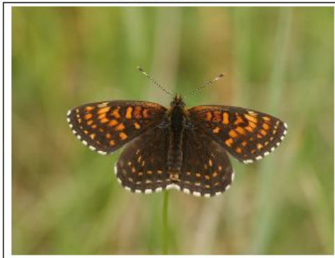
Hnědásek rozrazilový Melitaea diamina