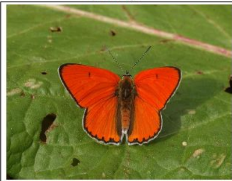
Ohniváček černočárný Lycaena dispar