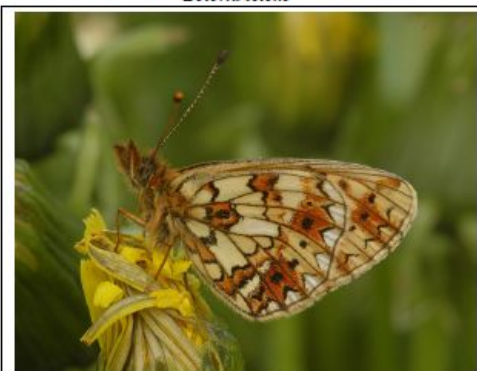
Perleřovec dvanáctitečný Boloria selene