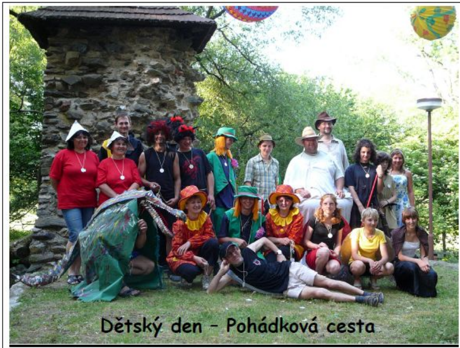
Dětský den - Pohádková cesta