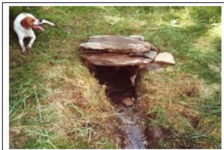
Opravená studánka „U mlíře“